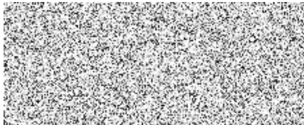
Vodovody a kanalizace Hradec Králové a.s.

Platnost tohoto vyjádření je jeden rok ode dne vydání.